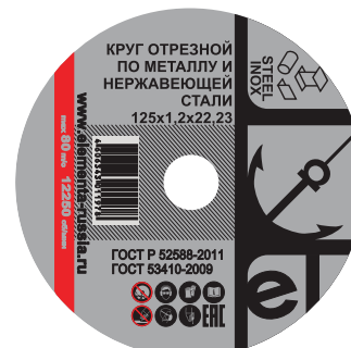
Отрезной круг для резки стальных и нержавеющей металлоизделий