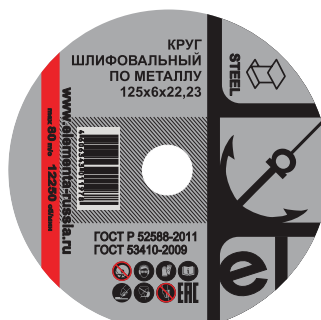
Отрезной круг для обработки стальных металлоизделий