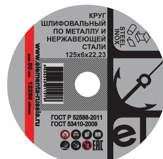
Отрезной круг для обработки стальных и нержавеющей металлоизделий