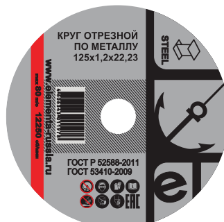
Отрезной круг для резки стальных металлоизделий